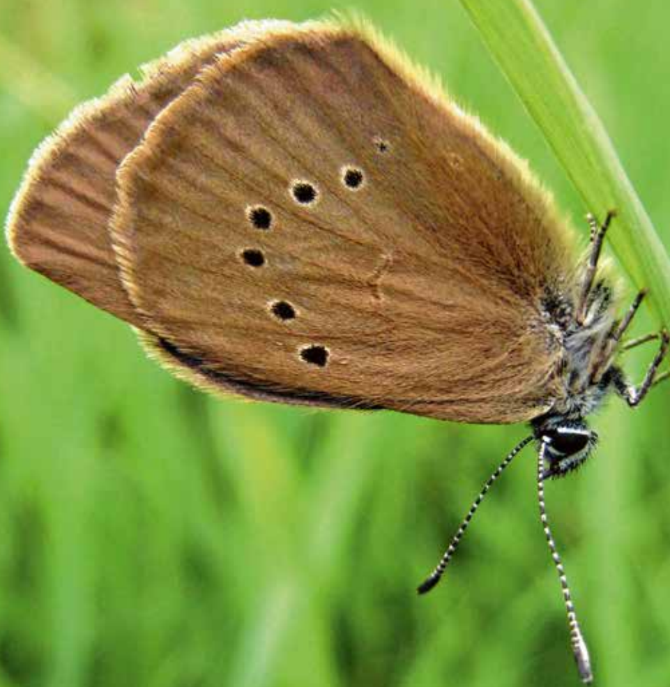
Abb. 1: Der Dunkle Wiesenknopf-Ameisenbläuling, ein gefährdeter Spezialist im Rurtal.