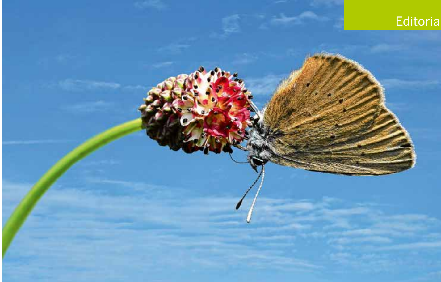
Ein deutsch-niederländisches INTEREGG-Projekt zielt darauf, die Vorkommen des Dunklen Wiesenknopf-Ameisenbläuling beidseits der Grenze miteinander zu vernetzen.