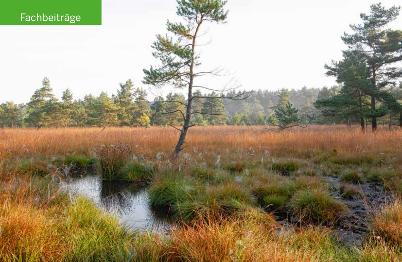
Abb. 1: Blick ins Projektgebiet Schwarzes Bruch.